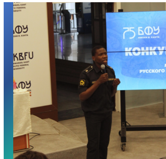
КОНКУРС ЧТЕЦОВ РУССКОЙ ПОЭЗИИ