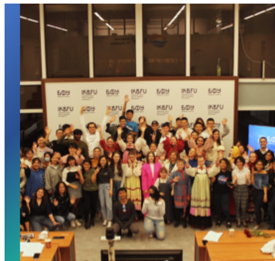
МЕЖДУНАРОДНАЯ СТУДЕНЧЕСКАЯ ОЛИМПИАДА ПО РУССКОМУ ЯЗЫКУ