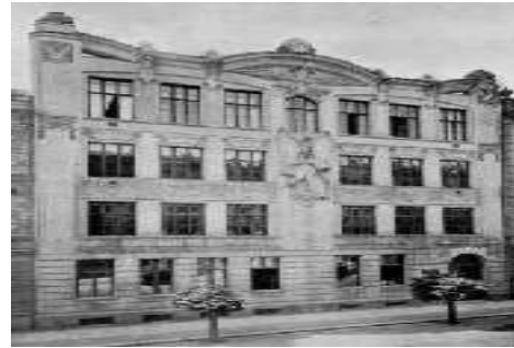
První budova VUT